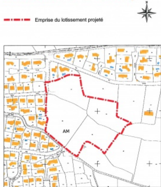
Echelle : 1/2000